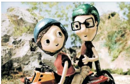
'Unha viaxe rodada'

¡Muchas gracias, responsables de la Xunta de Galicia, por permitirnos entregar estas tres obras de orfebrería cinematográfica!