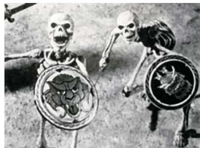
Imagen de 'Jasón y los Argonautas', de R. Harryhausen

Las películas en stop motion tienen un encanto especial, como ha demostrado una vez más Tim Burton, con "La novia cadáver", o los Estudios Aardman, con "La maldición de las verduras". Desde luego, no todo el público valora que estas películas se filmen fotograma a fotograma con miniaturas. Nos hemos topado con espectadores que piensan que ¡han sido hechas por ordenador! Lo cierto es que, salvo sus efectos especiales, tanto "La novia cadáver" como "La maldición de las verduras" fueron rodadas en Inglaterra en estricta stop motion, por animadores muchos de ellos formados por