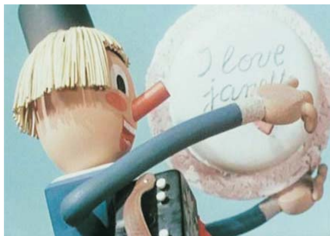
'Tulips Shall Grow' de George Pal