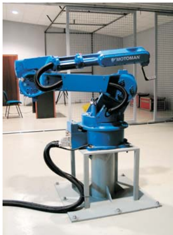
Motion control, robot en IB Cinema

La sala HAL 9000, de post producción digital, es en la que se añaden algunos efectos especiales, como gotas o nieblas, amén de proceder al montaje. Pero, previo a todo ello, está el trabajo de administración y producción, y también el de investigación y guión. Toda esta infraestructura, única en España, la albergamos en un Estudio con unos setecientos metros cuadrados construidos, ubicados en la ciudad de A Coruña (Galicia). Y lo mas importante: I.B.Cinema dispone de todo el equipo